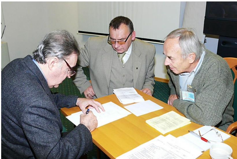
Komisja skrutacyjna podczas liczenia głosów oddanych na prace zgłoszone do konkursu w edycji 2009

Objaśnienie skrótów: Mt – mapa turystyczna; Pm – plan miasta; SzMŚ+a – szkolne mapy ściennie i atlasy; Im (+a) – inne mapy podręczne i ściennie (i atlasy); NP – Nagroda Publiczności