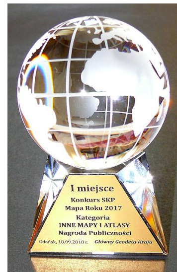
Pamiątkowa statuetka ufundowana przez Głównego Geodetę Kraju dla zwycięzcy w jednej z kategorii konkursu w edycji 2017.