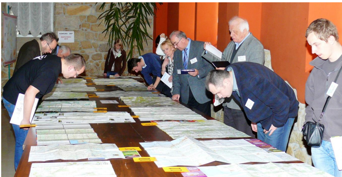
Wystawa prac konkursowych w edycji 2010.