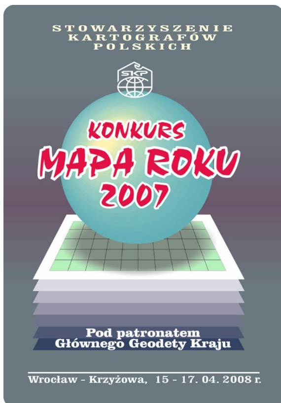
Plakat Konkursu edycji 2007 projektu S. Rogowskiego.