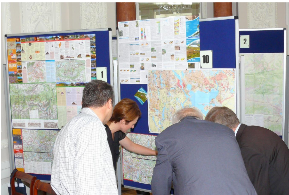
Wystawa prac konkursowych w edycji 2014.

Nagrody przyznawane w konkursach miały przede wszystkim symboliczny i honorowy charakter, bowiem były to tylko pamiątkowe, drukowane plakietki/dyplomy przyznawane za zdobycie pierwszego miejsca, a jako wyróżnienie (czyli za miejsca drugie i trzecie) wydawcy