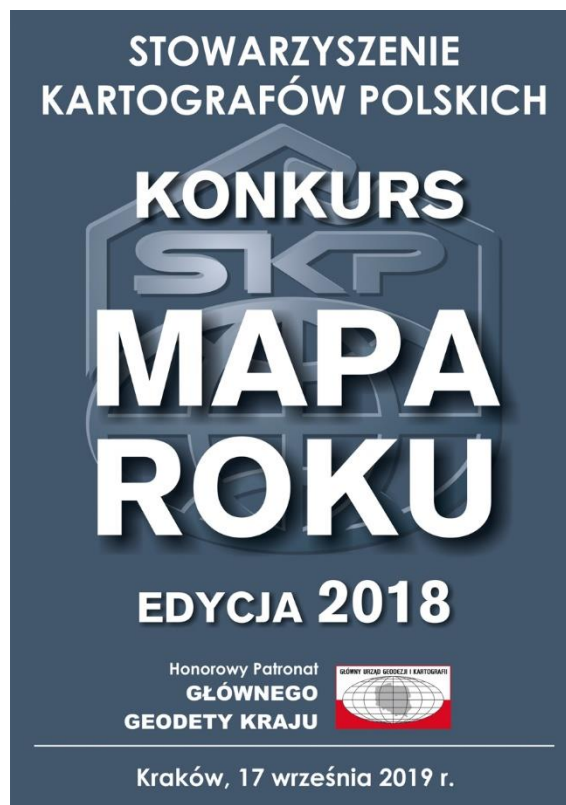
Plakat Konkursu edycji 2018 projektu Waldemara Spallka.